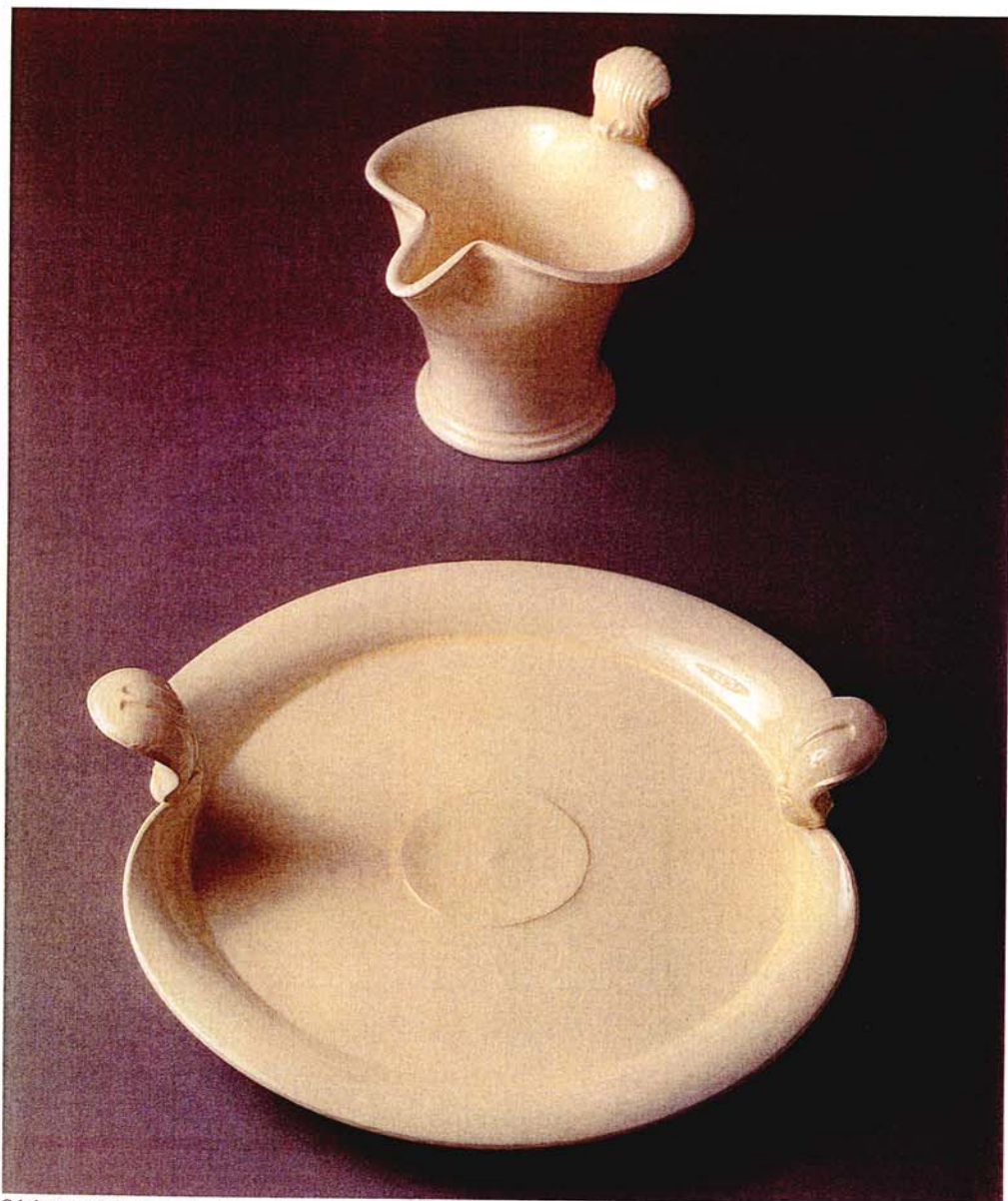
Crémier et grand plat à anses. Porcelaine cuite à haute température

Extrait d'une conversation avec Takeshi Yasuda