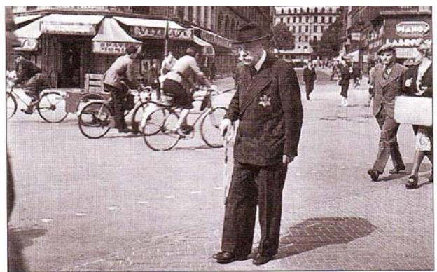
▲ 2. Vieil homme juif dans Paris occupé. À partir de 1942, les Juifs sont obligés de porter une étoile jaune sur leurs vêtements.