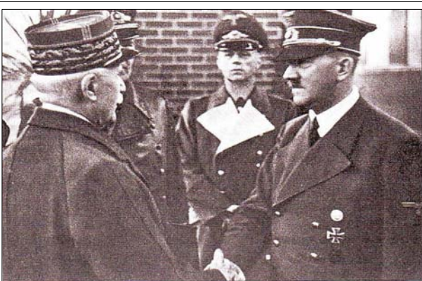
▲ 1. Adolf Hitler et le maréchal Pétain se rencontrent à Montoire-sur-le-Loir, en 1940.

Pendant que certains, comme le maréchal Pétain, collaborent avec l'occupant nazi et se mettent à son service (> doc.1) – et même combattent sous l'uniforme allemand -, d'autres résistent.