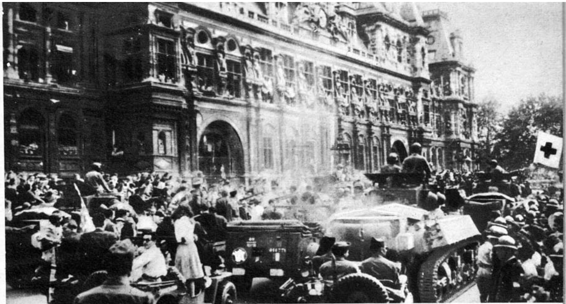
4. La libération de Paris.